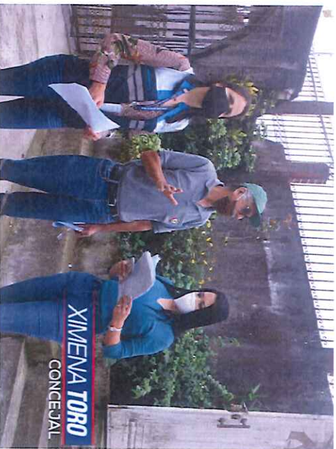
La Diócesis de Santo Domingo

Visitamos los predios dados en comodatos, con el objetivo de verificar el buen uso de los bienes.