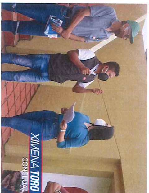
Visitamos la Unidad Educativa Especial Integral Fe y Alegría