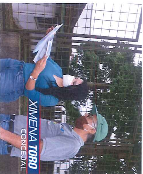
La Pontificia Universidad Católica